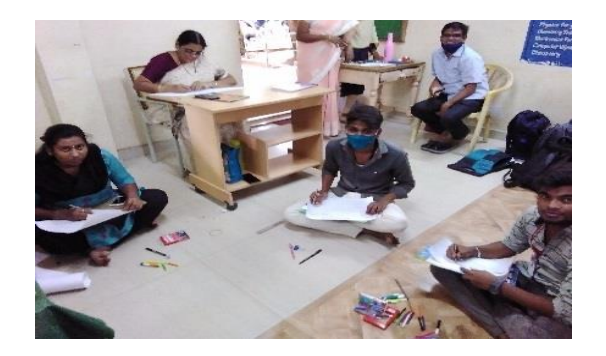
Day 6: A drawing and painting competition was conducted on " Natural Landscapes & Sceneries ". The paintings of the students included pencil drawings, crayon paintings and creative arts.

Day 7: A guest lecture on "Importance of Digital Libraries in Present Age" was organized with Dr. Illa Ravi, Principal, GDC Mylavaram. The librarian of Social Welfare Residential College for Girls (SWRCG), Kanchikacherla was also invited to give a lecture on the same day.